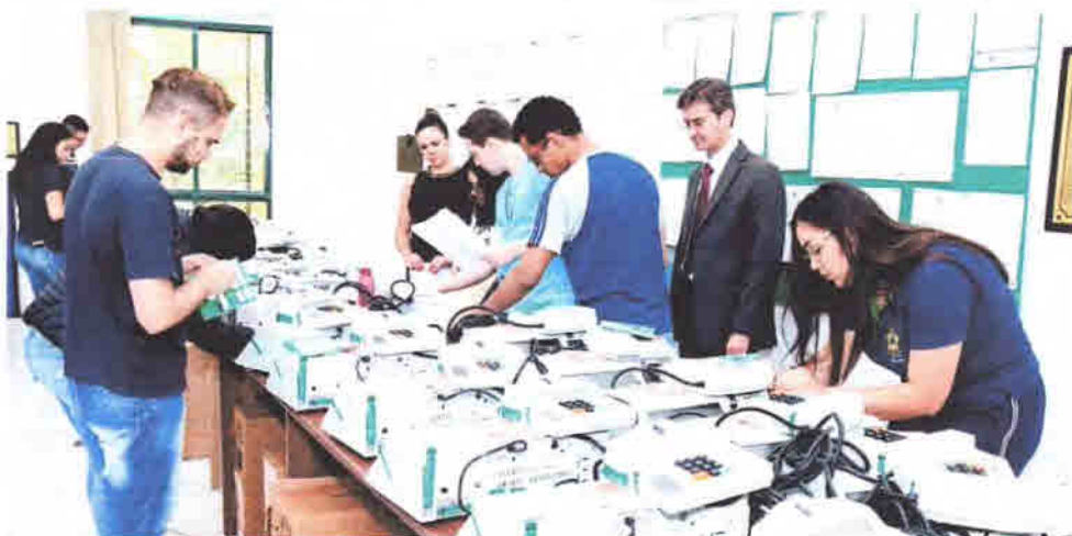
Urnas foram lacradas entre terça-feira e ontem na Comarca de Apucarana