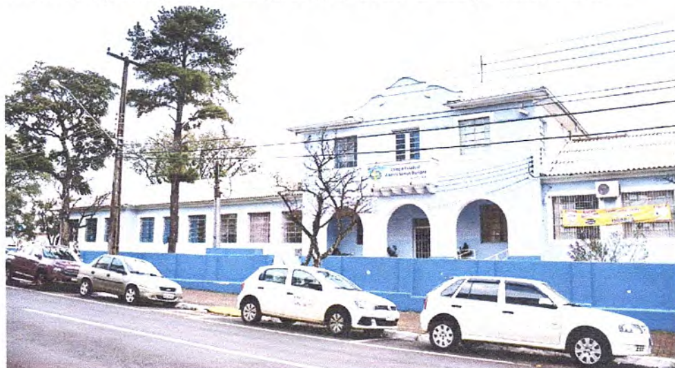
Instalações do Colégio Santos Dumont foram aprovadas pela PM do Paraná

Chefe da Casa Civil, Guto Silva, confirmou ontem que unidade vai funcionar nas instalações da escola Santos Dumont