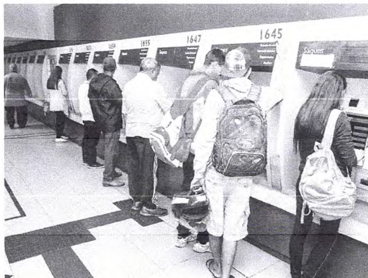
Pagamento é liberado diretamente na conta dos correntistas na Caixa