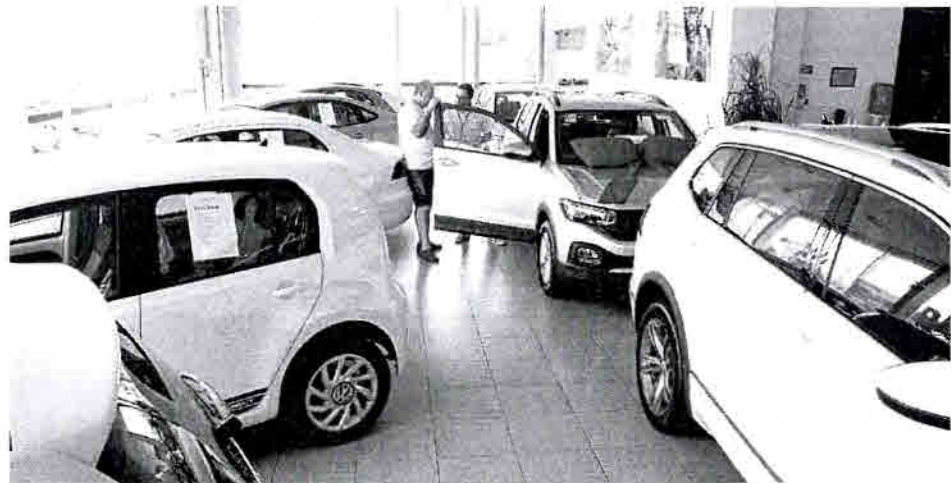
Vendas de carro zero quilômetro seguem aquecidas no início do ano

Regina Duarte aceita convite de Bolsonaro e assume Cultura POLÍTICA/PÁG. A3