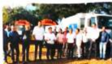
Prefeitura apresenta veículos novos.

A frota de veículos de Arapongas está recebendo um investimento milionário, que totaliza mais de R$ 1 milhão em investimentos. Na tarde de ontem, o prefeito Sérgio Diniz (PSD) oficializou a entrega de um caminhão novo para a Secretaria de Serviços Públicos e Meio Ambiente, três ambulâncias Mercedes Sprinter para a Secretaria de Saúde e um microônibus e um Terço K para a Secretaria de Assistência Social. Na solenidade, o prefeito anunciou para 5 de julho a reinauguração do 24 horas.