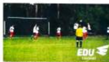
Avaliação é aberta para atletas de Apucarana e região.

O Instituto Gera, de Apucarana, e o Grêmio, de Porto Alegre, realizam nos dias 7 e 8 de junho, em Apucarana, uma avaliação técnica para atletas da cidade e de toda a região.