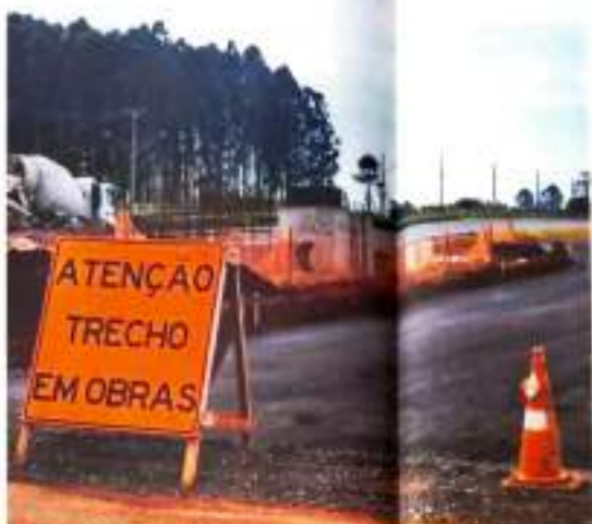
Empresários reclamam da dificuldade de acesso por conta da obra.

A direção da Companhia Horizonte ressaltou que a melhoria é muito necessária e que todos terão benefícios,