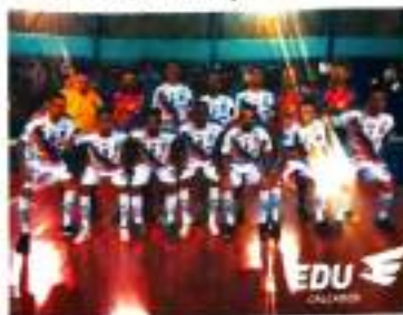
O Mauá da Serra sobra e joga F com 30 pontos.

O time do Mauá da Serra pode garantir neste sábado, às 20 horas, no Ginásio Mascadão, em Mauá da Serra, a classificação por antecipação para a segunda fase do Campeonato da Série Bronze de Futebol Adulto. Para alcançar essa meta basta vencer o Lokomotiva, de Apucarana, em partida que abre o retorno da fase inicial.