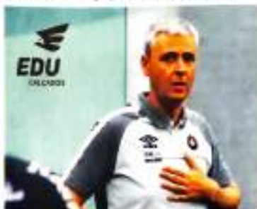
Tiago Nunes terá audiência na Athletico

Depois de se encontrarem pela Campeonato Brasileiro, com vitória do Tricolor na capital cearense, Fortaleza e Athletico agora duelam pelas oitavas de final da Copa do Brasil, hoje, às 19h15, no Arena Castelão. Desta vez, entretanto, é mais mata, valendo um bom prêmio e a vaga nas quartas de final da competição.