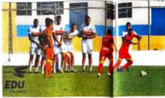
Na primeira fase do Estadual, o Rolândia venceu a Apucarana por 3 a 1

Os jogos do retorno do Apucarana na segunda fase são os seguintes: dia 9 de junho, Apucarana x União de Francisco Beltrão (Estádio Olímpio Barreto); dia 16, Apucarana x Batel (Estádio Olímpio Barreto); e dia 23, Rolândia Esporte