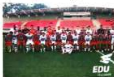
São Paulo e Apucarana jogaram ontem em GOMI

Em amistoso realizado nesta quarta-feira à tarde no Centro de Treinamento de Cotia-SP, pela categoria sub-19, o São Paulo derrotou o Apucarana Sports por 4 a 0. A partida serviu de treinamento para o Apucarana que vem disputando o Campeonato Paranaense da categoria.