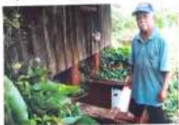
Sen. Hiroshi Fukumoto morava na final de semana.

"A única saída seria a aquisição do terreno e o projeto deve que tem interesse. Será uma forma de dar continuidade ao