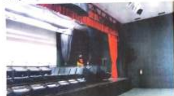
Novo espaço cultural de toda comunidade