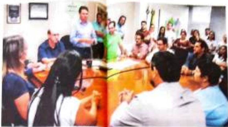
Trabalho de equipe para a obra de reforma em comunidade do bairro

A escola do Jardim Ponta Grossa é uma das 60 escolas e creches da rede municipal de ensino de Apucarana. A obra será executada pela empresa de engenharia e construção civil, a Engenharia e Construção Civil Ltda. A obra será executada em duas etapas. A primeira etapa prevê a reforma da estrutura física da escola, com a substituição de telhas, pintura das paredes e reforma das instalações elétricas e hidráulicas.