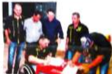
Um grupo de voluntários do Moto Clube de Apucarana doando uma máquina de fraldas para o Centro de Oficinas de Apucarana.

Equipamento será instalado no Centro de Oficinas de Apucarana